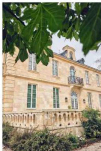
Château Kirwan. M. S.

Réserver dès maintenant sur le site officiel de l'EFS : dondesang.efs.sante.fr .