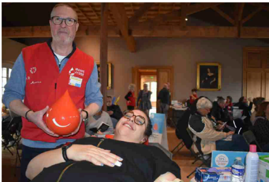
L'association des Donneurs de sang de Macau et communes avoisinantes a organisé lundi la première collecte dans un château du Médoc. M. I.

En parallèle, l'association a travaillé avec l'Établissement français du sang concernant les prérequis indispensables pour la salle : 150 m 2 minimum, pièce lumineuse, accès PMR (personnes à mobilité réduite), ligne téléphonique cryptée, toilettes, issues de secours, parking. L'office du tourisme a lancé un appel aux volon-