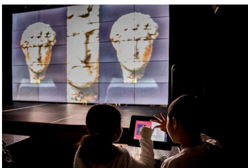
MF Sevrans - musée numérique