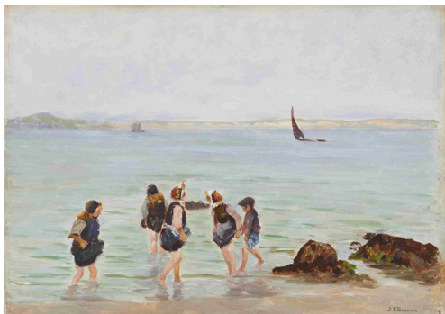
Joseph-Félix Bouchor, Les pataugeuses (Début XXe siècle)