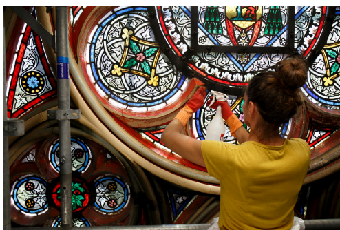
Nettoyage des vitraux dans la cathédrale David Bordes © EP Rebâtir Notre-Dame de Paris

Beaux-arts, architecture, cultures scientifiques, spectacle vivant..., cette galerie virtuelle incite à la curiosité, s'adresse à tous les publics, et se décline en un véritable outil d'éducation artistique et culturelle. Elle réunit plusieurs milliers de chefs d'oeuvre de nombreuses institutions et musées à découvrir en visite libre ou en mode conférencier.