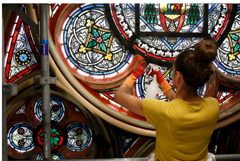
Nettoyage des vitraux dans la cathédrale

Beaux-arts, architecture, cultures scientifiques, spectacle vivant..., cette galerie virtuelle incite à la curiosité, s'adresse à tous les publics, et se décline en un véritable outil d'éducation artistique et culturelle. Elle réunit plusieurs milliers de chefs d'oeuvre de nombreuses institutions et musées à découvrir en visite libre ou en mode conférencier.